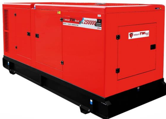
Zabudowa typu „Super-Silent” zapewniająca niski poziom hałasu podczas pracy urządzenia.