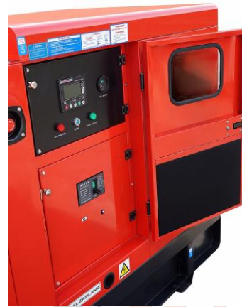
Panel sterowania umieszczony za drzwiami wyposażonymi w zamek.