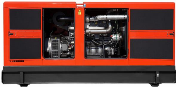
Dwuskrzydłowe drzwi wyposażone w zamek, umożliwiające bezproblemową eksploatację silnika spalinowego.