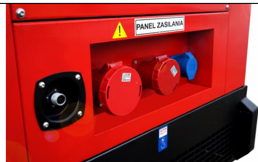
Panel odbioru mocy wyposażony w przyłącza o wysokiej klasie izolacji (IP-67), oraz gniazdo sterowania automatyką.