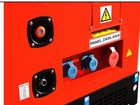
Panel odbioru mocy wyposażony w przyłącza o wysokiej klasie izolacji (IP-67), oraz gniazdo sterowania automatyką.