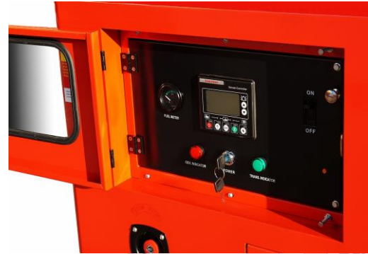
Panel sterowania umieszczony za drzwiami wyposażonymi w zamek.