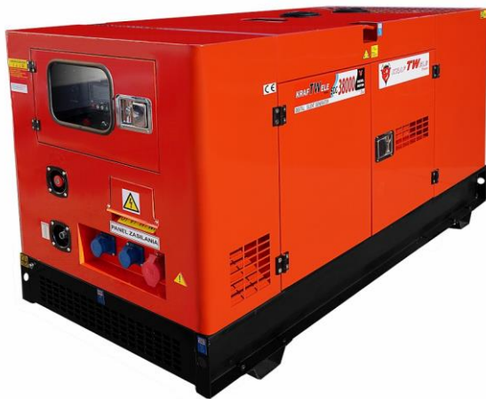
Zabudowa typu „Super-Silent” zapewniająca niski poziom hałasu podczas pracy urządzenia.