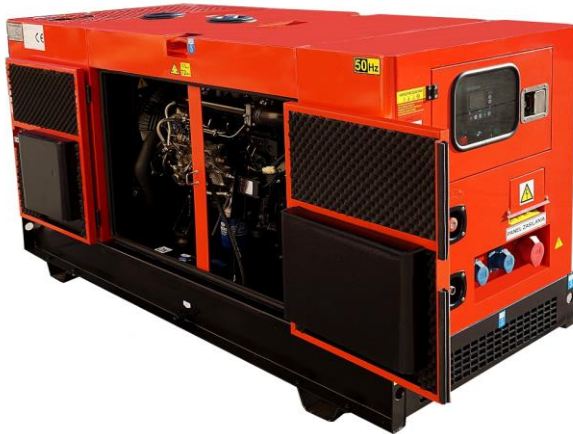
Dwuskrzydłowe drzwi wyposażone w zamek, umożliwiające bezproblemową eksploatację silnika spalinowego.